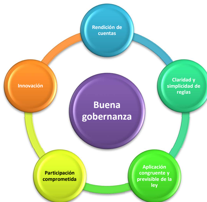
Figura 2. Ecosistema virtuoso de la buena gobernanza.

La gobernanza está determinada por una serie de decisiones cotidianas que toman los funcionarios públicos en una organización. La buena gobernanza busca tomar estas decisiones en el mejor interés público con base a cinco criterios que conforman un ecosistema virtuoso: rendición de cuentas, claridad y simplicidad de reglas, aplicación congruente y previsible de la ley, participación comprometida y la innovación como impulso de un dinamismo transformador (GONZÁLEZ CAO, Procesos críticos y buena gobernanza, 2022).